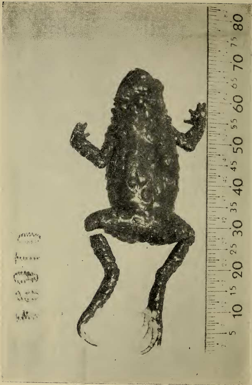
Figura N.º 1 — Vista dorsal do Holótipo